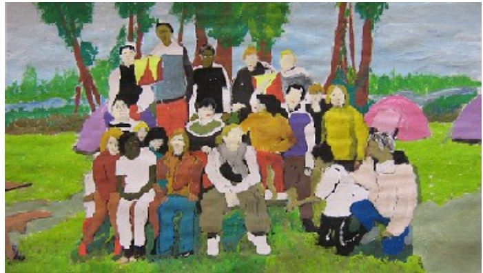
Les campeurs de Vers projettent un déplacement en Italie. Un projet Comenius de taille à suivre... Page 2